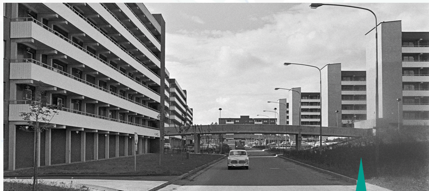
Tensta Allé, 1971.

Gravfältet är ca 1000 år gammalt från vikingatiden, och ligger inne i en slags liten skog längs Sundbyvägen nära Johannelundsvägen. Det består av ca 40 stycken gravhögar och låga gravar av sten. Många av gravarna har förstörts eller vandaliserats, men de mest tydliga gravarna ligger på skogskrönet.