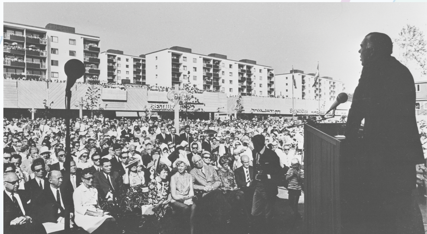
Inviqning av Skärholmens centrum 1968. Prins Bertil inviger.

Följ med på ett äventyr genom Skärholmen – en guide gjord av sommarjobbade ungdomar från området. Detta är en mångkulturell stadsdel och här bor invånare från olika delar av världen. Här finns mycket kärlek och gemenskap. En ikonisk stadsdel med urbana miljöer och härlig natur. Här finns det något för alla!