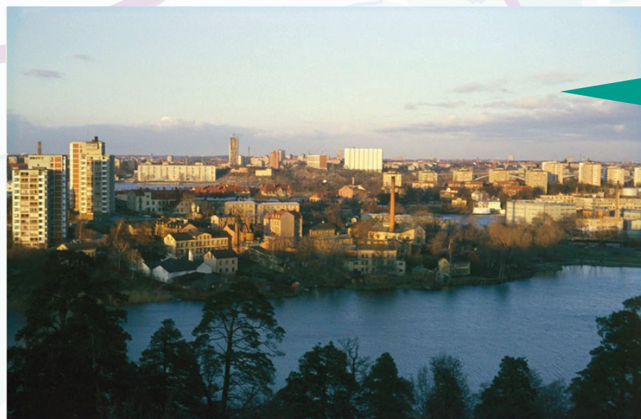
Gröndal, 1964.

Om du är nyfiken på Gröndal kika in på utkiksbacken21.se , en hemsida med både aktuell och historisk information om området.