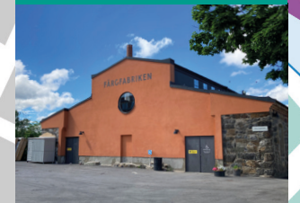
2. Lövholmens framtid