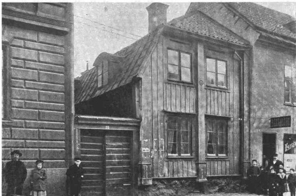
Källaren Gröna Jägaren, Sankt Paulsgatan 25.