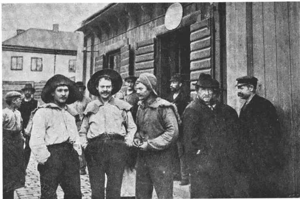
Utanför krogen »Masis Knosis» vid Kocksgatan.