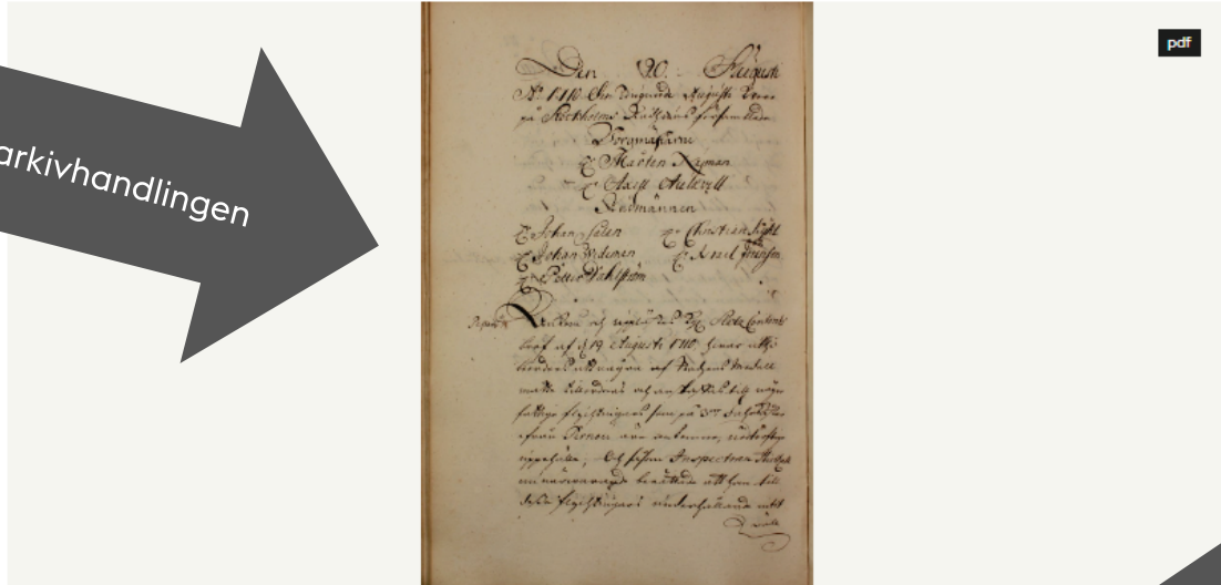
Bild på arkivhandlingen